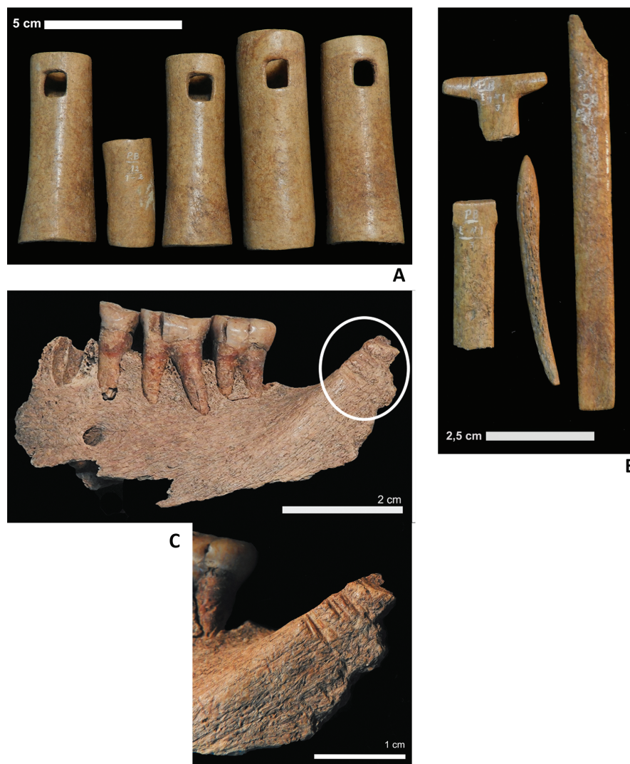
Figura 3. 3a. Ajuar funerario asociado con el entierro n° 1 de Palo Blanco, constituido por cuatro silbatos ( sensu Cigliano, 1960) de hueso. El objeto más pequeño es la boquilla de uno de ellos. 3b. Ajuar funerario correspondiente al entierro n° 1 de Palo Blanco, constituido por un punzón de hueso y tres fragmentos de, al menos, dos tembetás. 3c. Mandíbula humana con probables huellas de corte correspondientes al sitio Palo Blanco, hallados en el depósito n° 25 de la División Arqueología (MLP).

Finalmente, en el Depósito de Arqueología fue identificado un fragmento de lateralidad izquierda de una mandíbula humana, con los alvéolos del