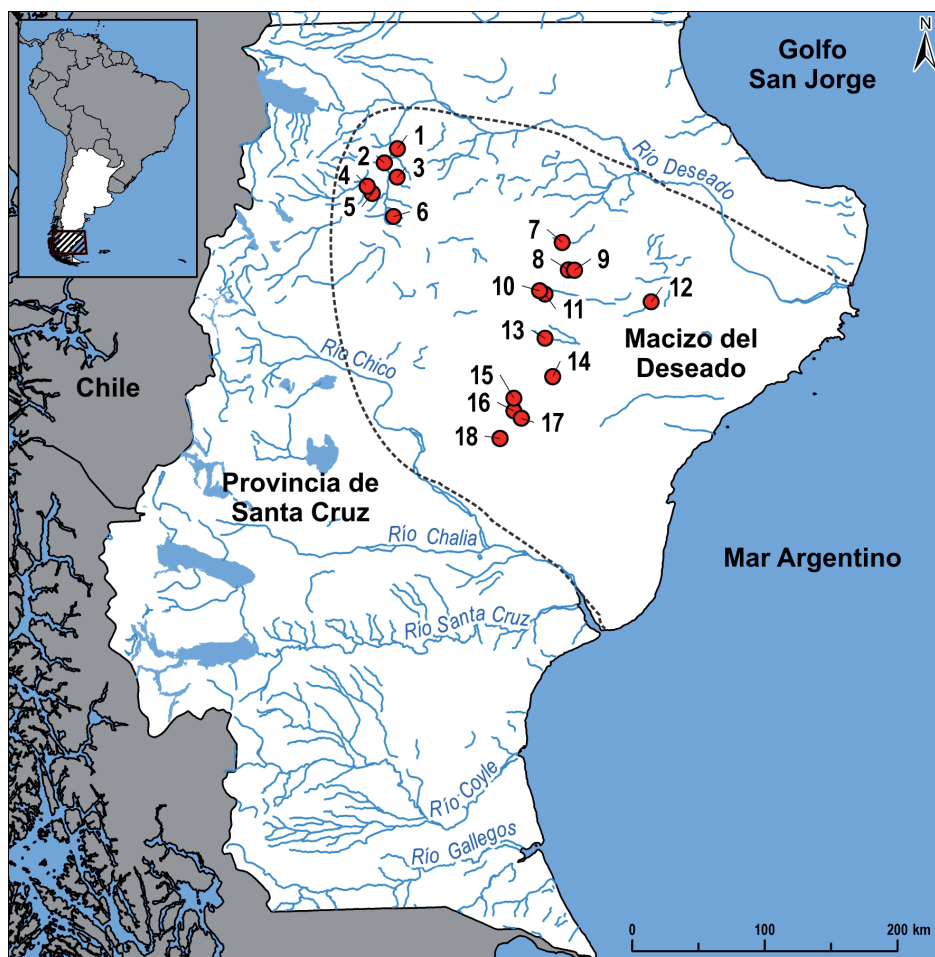
Figura 1. Sitios y localidades arqueológicas del Macizo del Deseado considerados en este trabajo. 1) Alero Rosamel, 2) Cueva Grande del Arroyo Feo, 3) Alero Charcamata, 4) Cueva de las Manos, 5) Alero Cárdenas, 6) Alero del Búho, 7) Los Toldos, 8) Cueva Moreno, 9) Cueva de la Hacienda, 10) Cueva Mora, 11) Cueva Maripe, 12) Piedra Museo, 13) Cerro Tres Tetras, 14) La María, 15) La Martita, 16) Viuda Quenzana, 17) El Verano, 18) La Gruta. Referencia: el Macizo del Deseado está delimitado por una línea punteada.

El Macizo del Deseado es una provincia geológica ubicada en la provincia de Santa Cruz, Patagonia argentina (De Giusto et al. 1980). Está limitado al norte por el río Deseado, al sur por el río Chico, al oeste por la cordillera Patagónica Austral y, al este, por el mar Argentino (Figura 1). Se incluye en el dominio de la Patagonia extraandina, donde las precipitaciones anuales están por debajo de los 200 mm y la temperatura promedio es de 8-10 °C. Esto permite clasificarlo como un sector semiárido y templado-frío en el que se desarrolla una vegetación de estepa arbustiva/graminosa (Oliva et al. 2001; Mancini et al. 2012). La oferta de recursos