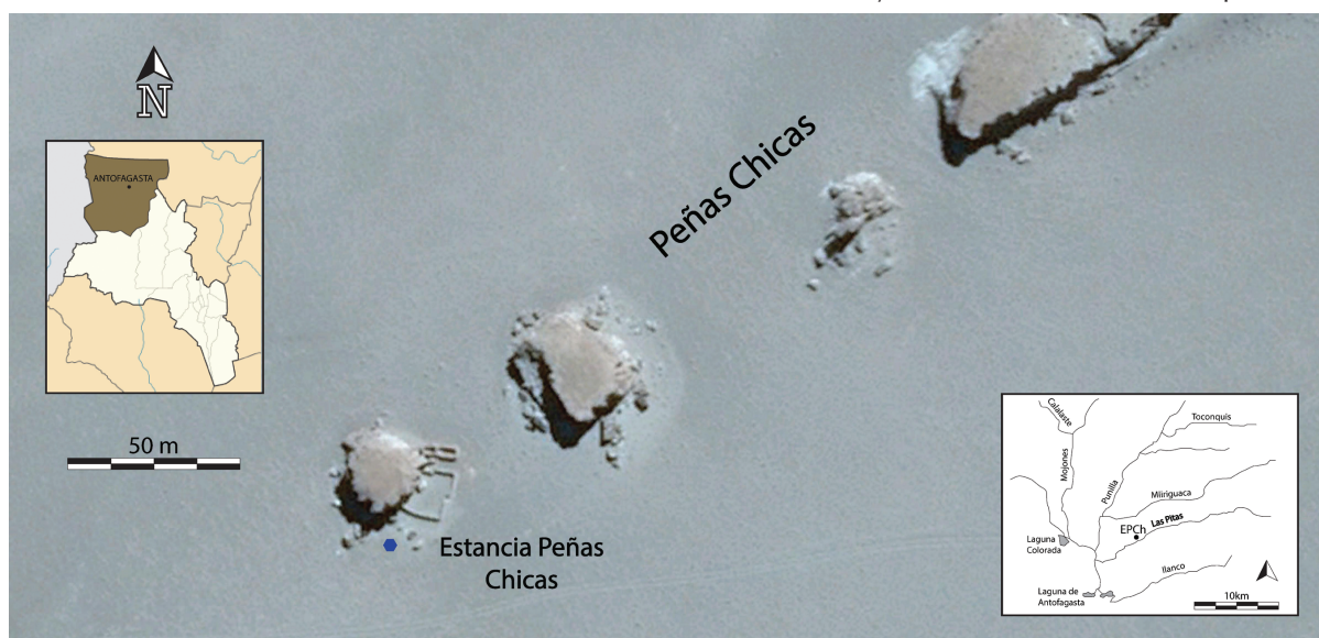
Figura 1. A la izquierda, departamento de Antofagasta de la Sierra en la provincia de Catamarca. A la derecha, el río Las Pitas en la cuenca. En el centro, la estancia en las Peñas Chicas.

Durante la Colonia, Antofagasta estuvo ligada administrativamente a la ciudad de Londres y a la gran Gobernación del Tucumán, dependiente del Virreinato del Perú. En el mundo andino, las transformaciones sociales, económicas y políticas desde el siglo XVI estuvieron modeladas por un orden propio del dominio colonial que afectó a todas las comunidades, aunque las consecuencias desestructurantes en la vida de estas fueron diferentes, según sus trayectorias históricas, sus estrategias de resistencia y los intereses coloniales específicos