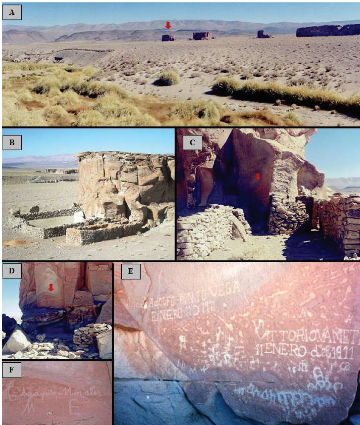
Referencias: A: La estancia en las Peñas Chicas. B: Vista de la estancia desde el noreste. C: Interior de la estancia desde el pasillo (la flecha señala los grabados). D: Chiquero y grabados. E: Grabados en la estancia (panel 1) y F: Grabados del chiquero (panel 2).