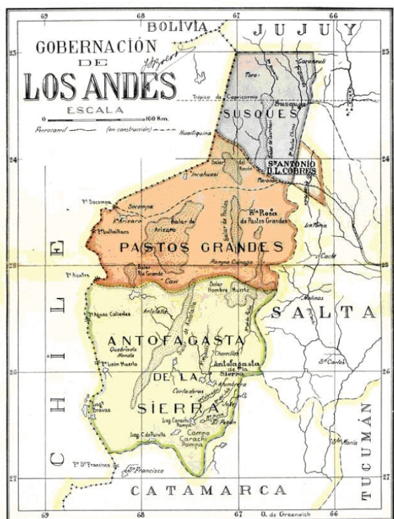
Figura 2. Territorio Nacional de Los Andes.

Al día siguiente de la creación del territorio nacional, en una misiva dirigida al presidente Julio A.